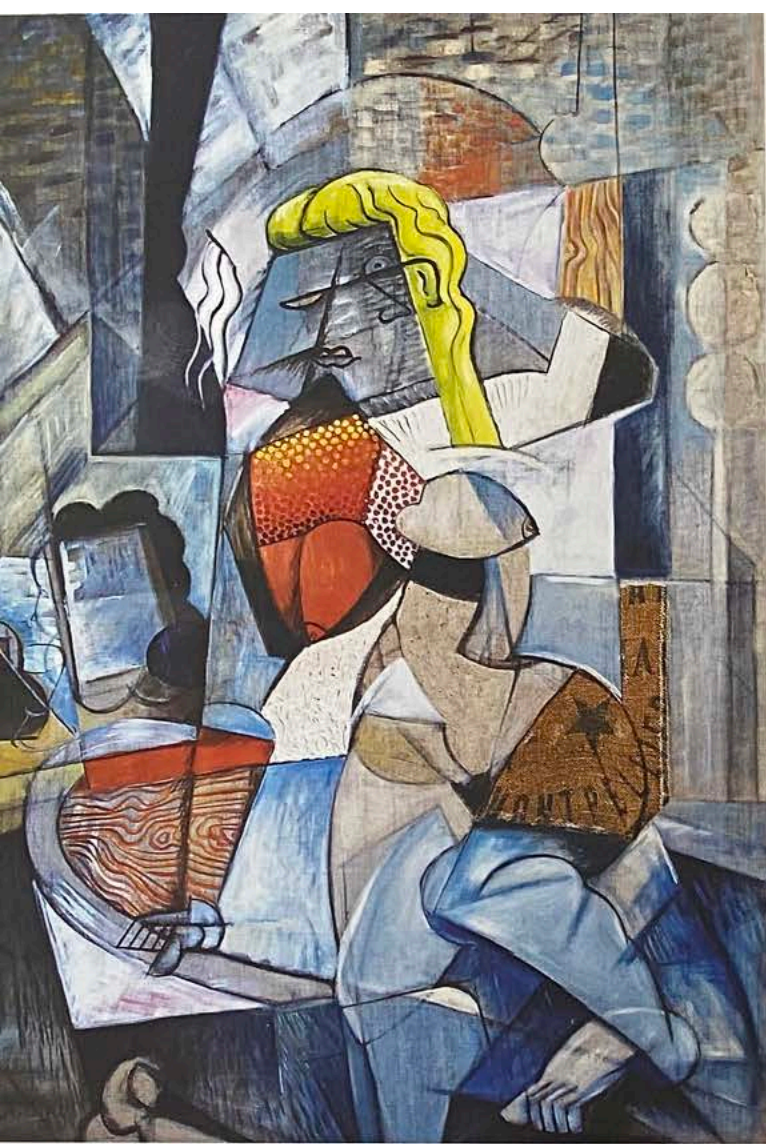
< Stil-voll Wolfgang Beltracchi „La Blonde de Montpellier“, 2015, Öl auf Leinwand, 150 x 110 cm