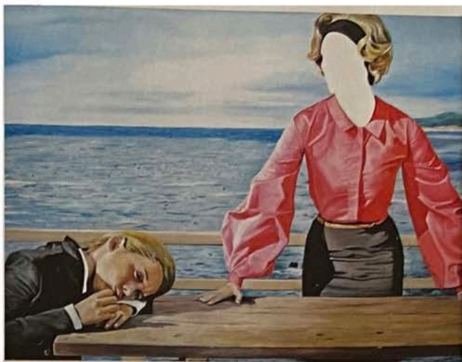
◀ Gesichtslos Constantin Schroeder, „Am Meer“, 2014, Öl auf Leinwand, 105 x 140 cm