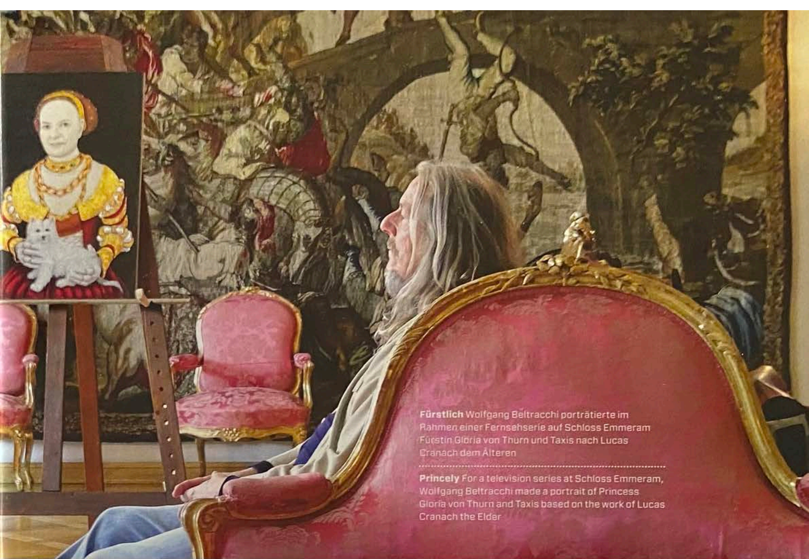
Fürstlich Wolfgang Beltracchi porträtierte im Rahmen einer Fernsehserie auf Schloss Emmeram Fürstin Gloria von Thurn und Taxis nach Lucas Cranach dem Älteren

Princely For a television series at Schloss Emmeram, Wolfgang Beltracchi made a portrait of Princess Gloria von Thurn und Taxis based on the work of Lucas Cranach the Elder